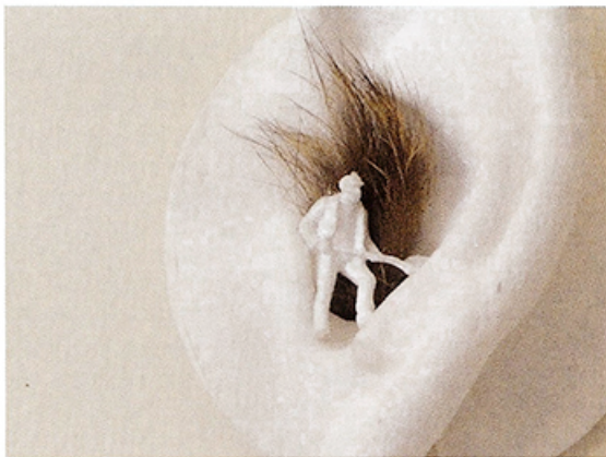
Le discours qui ne plaît pas , 2009. Gesso, rabbit skin, plastic, 2.3 x 2.9 x 1.2 in. Courtesy 13 Jeannette Mariani Gallery. Yeso, piel de conejo, plástico. 6 x 7,5 x 3 cm. Gent leza Galería 13 Jeannette Mariani.

Así como es posible pensar en el romanticismo, en las esculturas que conforman la muestra también hay algo de poesía surrealista, algo de absurdo, inquietante en estos objetos y personajes minúsculos que nos muestra la artista y que hacen recordar a los hombres de Magritte. Un mundo mágico, intemporal, que impacta por la manera en que logra crear una especie de nueva arqueología escultórica. En el caso de la obra Le discours qui ne plaît pas , nos preguntamos: ¿qué