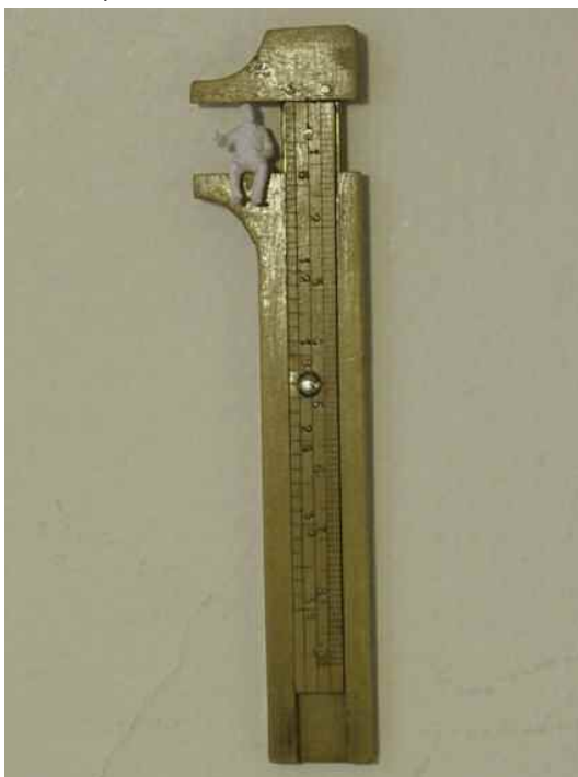
Le Conformiste - 2009 - bois, plastique - 3x12x1 cm -

Galerie 13 Jeannette Mariani 36 rue du Mont Thabor 75001 Paris 01 40 15 02 80 / 06 65 50 80 48 galerie13jm@orange.fr www.galerie13jm.com