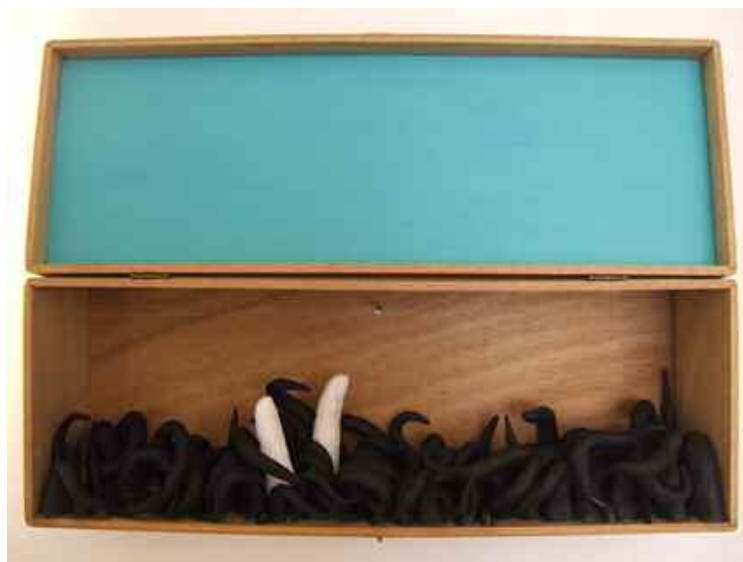
Voyage À Deux - 2009 - terre cuite, plâtre, bois - 37x26x9 cm -

Dans l'œuvre L'Attente par exemple, ce n'est ni la main, ni le sachet de thé, mais l'interaction entre ces deux éléments qu'il faut avant tout prendre en compte; le processus de sédimentation qui unifie la main moulée à l'extrémité du sachet de thé qui, peu à peu, lui aussi, commence à être gagné par la torpeur et la mort. L'attente est ici saisie dans son processus interne – montrée dans son avancée lente et irrémédiable : quelque chose persiste, en suspend, mais pour combien de temps encore ?