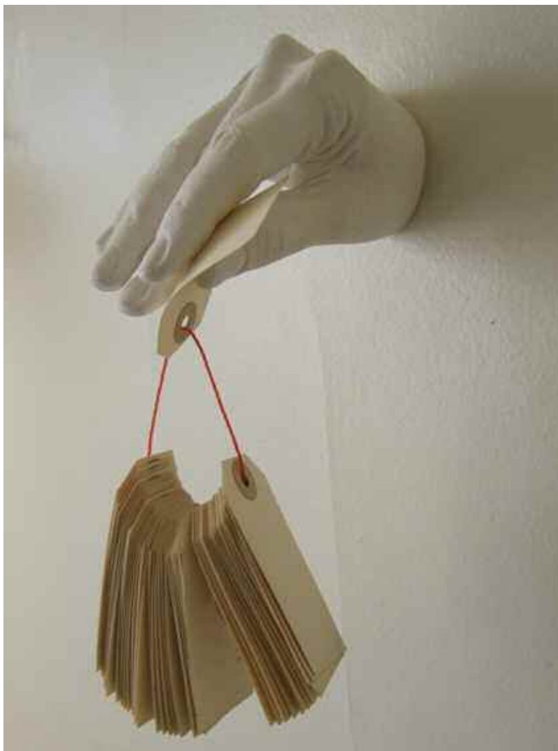
Le Hasard - 2009 - plâtre, papier, fil plastique - 8x22x11 cm -

>>> Vernissage le Jeudi 15 Octobre de 18h00 à 21h00 <<<