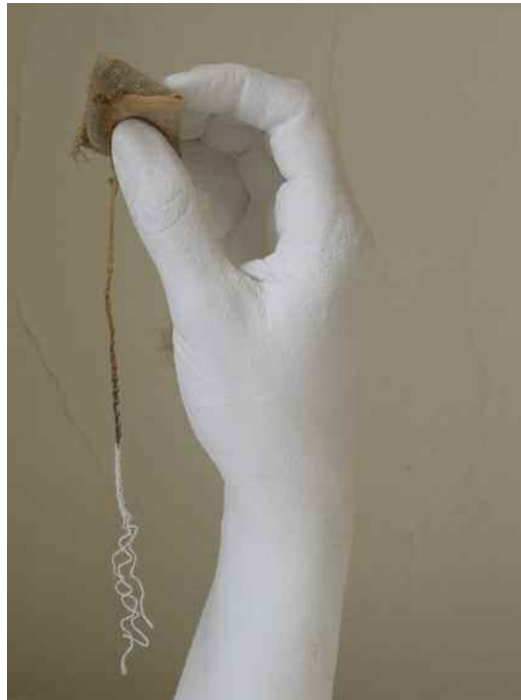
L'Attente - 2009 - plâtre, sachet de thé en tissu - 7x25x9 cm -

Et si la sculpture s'affranchissait de sa quête purement formelle pour devenir aussi réfléchie et dialectique qu'un discours; aussi précise et rigoureuse qu'un concept; aussi grinçante et imagée qu'une fable ?