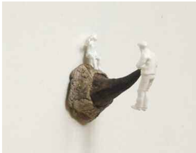
La Vengeance - 2009 - épine, plastique - 2x3x3 cm -

Voilà, en tout cas, le défi que semble s'être lancée l'artiste Sabrina Montiel-Soto, en abandonnant, le temps d'une exposition au moins, sa pratique, quasi scientifique, de cinéaste multimédia.