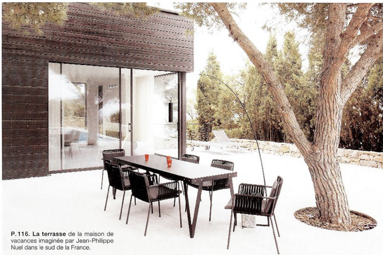
P.116. La terrasse de la maison de vacances imaginée par Jean-Philippe Nuel dans le sud de la France.