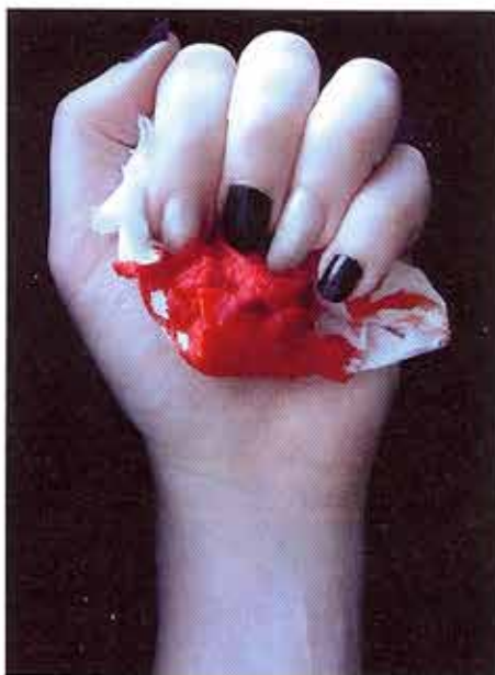
MEDIATOR Vena amoris 2009, image digitale, 76 x 51 cm.